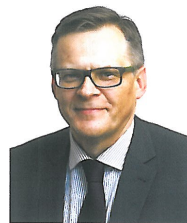
PREZES KASY ROLNICZEGO UBEZPIECZENIA SPOŁECZNEGO